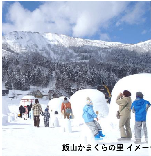
飯山かまくらの里 イメージ